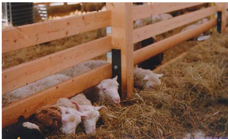
1200 kvadratmeter fårhus har uppförts för 1,35 miljoner, men det var först kostnadsberäknat till 3,5 miljoner.

På den del som inte betas tas två ensilageskördar per år med målet att få så hög kvalitet på ensilaget som möjligt.